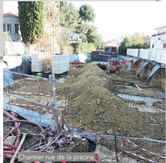
Chantier rue de la piscine