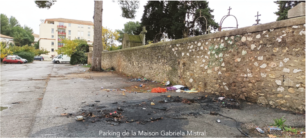
Parking de la Maison Gabriela Mistral