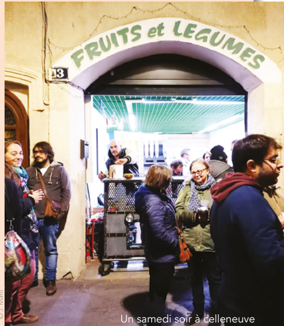
Un samedi soir à celleneuve

Les dons à notre association ouvrent droit à une réduction d'impôt égale à 66% du montant des dons, dans la limite de 20% du revenu imposable.