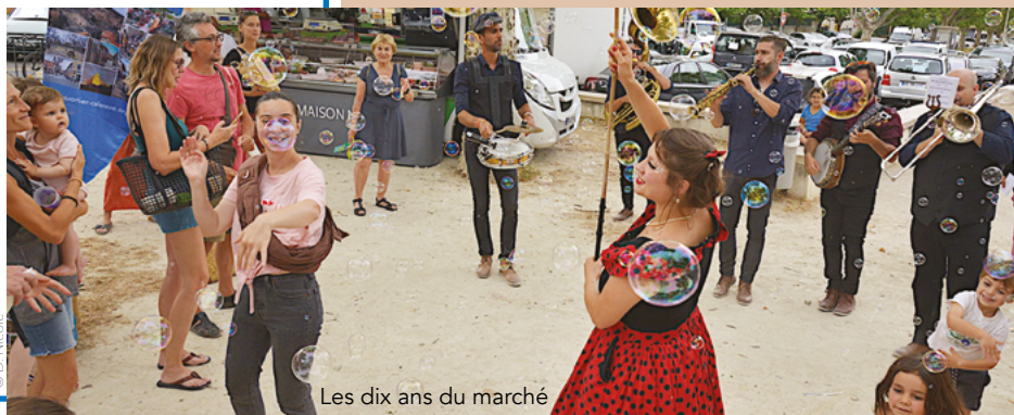
Les dix ans du marché

Photo de couverture : Animation pour les dix ans du marché